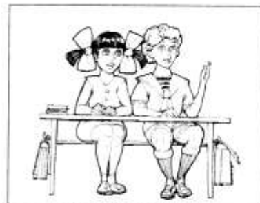
ВЫПОЛНЯТЬ ЗАДАНИЯ УЧИТЕЛЯ