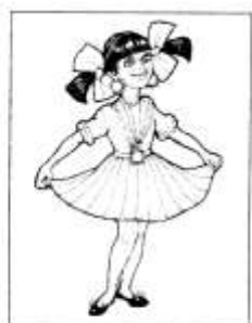
ПОХВАСТАТЬСЯ НОВОЙ ОДЕЖДОЙ